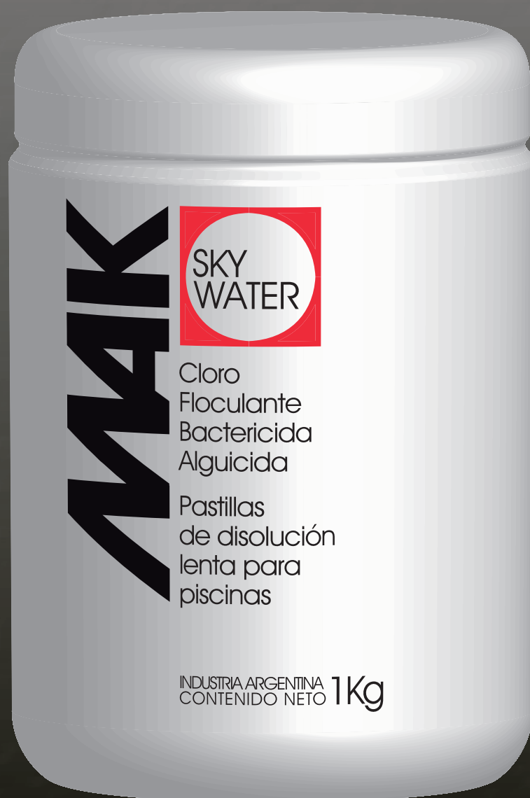
MAK SKY WATER Pastilla multiple efecto